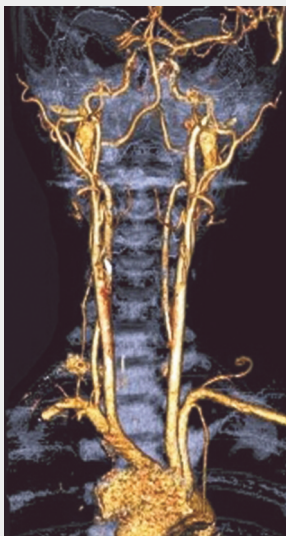
Reconstruction 3-D par angioscanner

IV èmes Journées de Formation et d'Actualisation en Pathologie Vasculaire